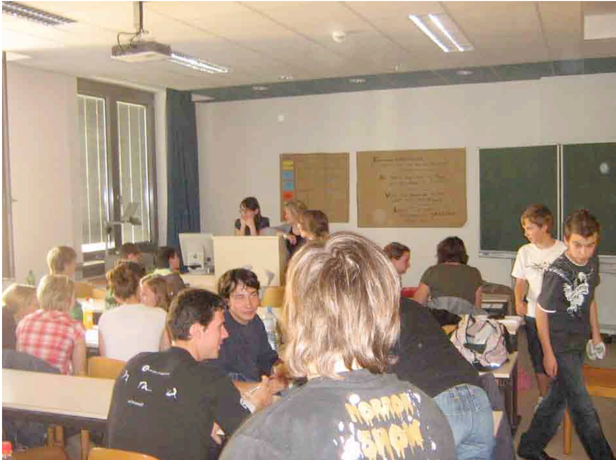
Angeregte Diskussion im Seminarraum zwischen Studenten der Uni Wien und den Gymnasiasten