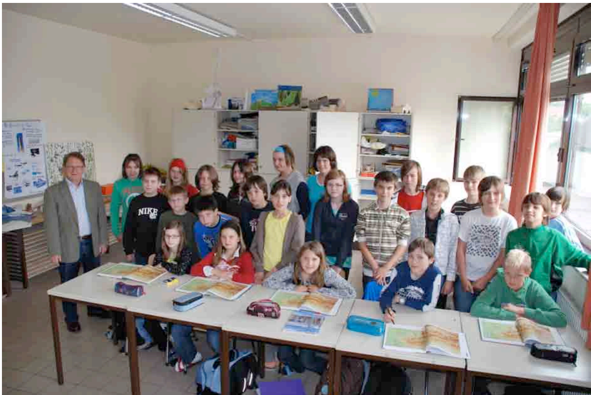
Die 2A-Klasse am Ende der Geographie-Stunde

Auch im Schuljahr 2008/09 kommt es zu einer Zusammenarbeit des Gymnasiums Neusiedl mit der Universität Wien: Drei Studenten des Geographischen Instituts der Universität Wien unterrichten im Rahmen ihres fachbezogenen Schulpraktikums Geographie und Wirtschaftskunde in den 2., 4. und 5. Klassen des Gymnasiums. Unter der Leitung von OStR Dr. Alois Wegleitner werden Unterrichtsstunden (Basisstoff) zu: „Verkehrsmittel und -arten“, „Menschenleere und Überbevölkerung“, „Demographie“ sowie „Wirtschaftsgeographische Grundbegriffe“ vorbereitet und durchgeführt.